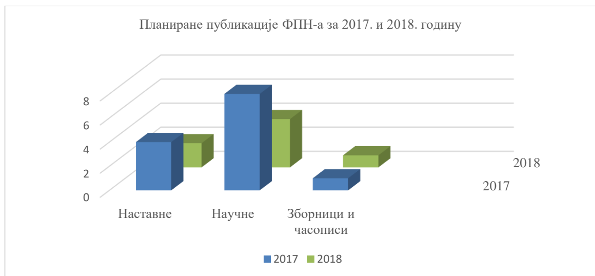
Графикон 2: Упоредни приказ планираних публикација ФПН-а за 2017. и 2018. годину