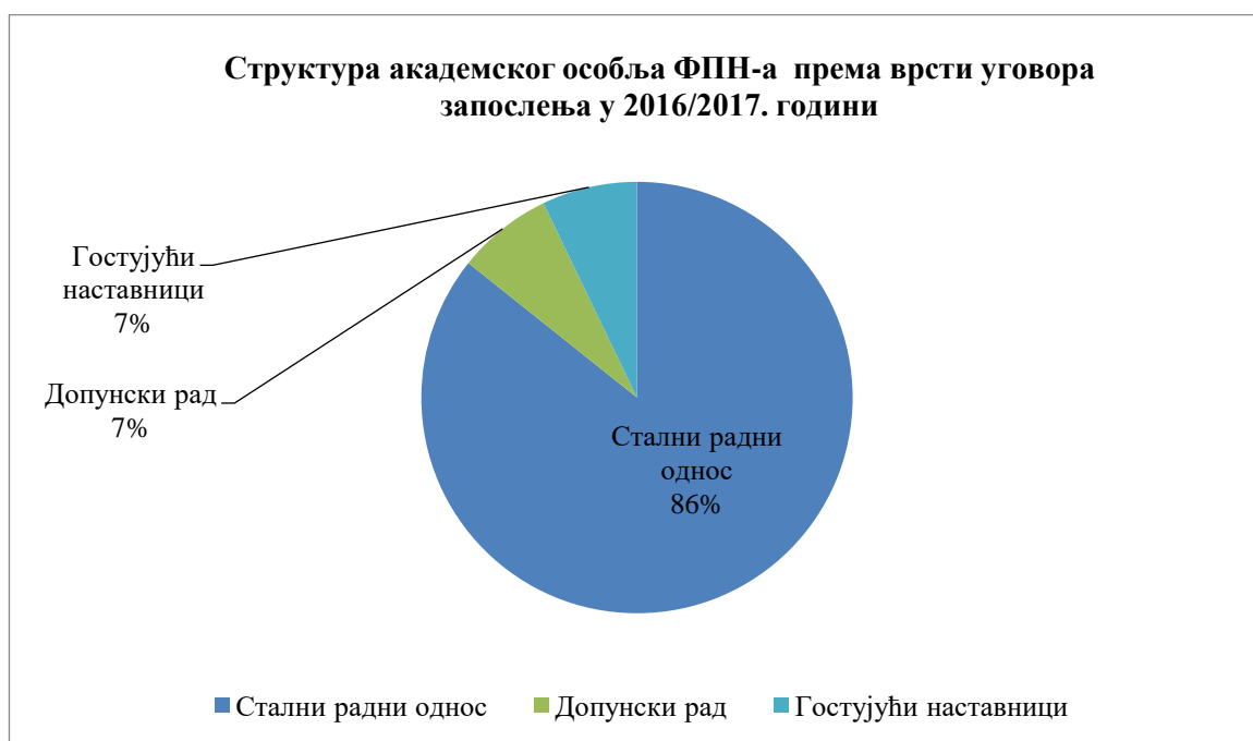
Графикон 1: Структура академског особља ФПН-а према врсти уговора запослења 2016/2017

На извођењу наставе током 2016/2017. године на ФПН УНИБЛ ангажовано је наставно особље у пуном радном односу (36 чланова), три (3) наставника у допунском раду, као и три (3) гостујућа наставника.