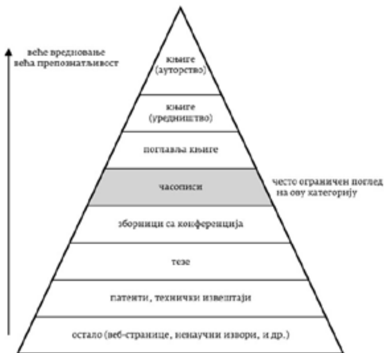
Приказ 4: Вредновање научних публикација на основу пирамиде публикација (Екснер, 2016).

Међу литературом у друштвеним наукама, предност имају књиге из разлога што се у академском писању претпоставке изводе ab initio , дакле, формирају се и излажу заједно са доказима који поткрепљују полазиште и аргументе. Приликом тражења литературе, осим књига, студент ће наићи и на друге врсте извора: приказе књига, поглавља у новим издањима књига (едитованим књигама), чланке у (научним и стручним) часописима, тзв. „ридере“ и скрипте приређене од стране наставника из дате области, специјализоване рјечнике препоручене у области у којој студент истражује. Постоји низ обиљежја који утичу како ће се хијерархијски вредновати одређени типови научних публикација. Овдје нећемо говорити о тим обиљежјима, али ће пирамида у наставку помоћи да студент схвати неопходност кориштења различитих врста извора при изради академских радова.