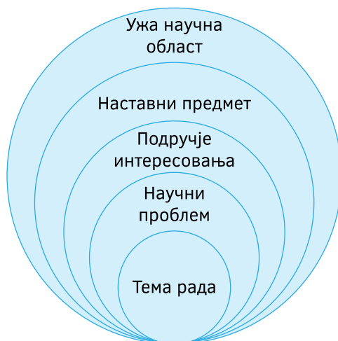
Приказ 1: Фазе процеса избора теме завршног рада

4. Вријеме је да изаберете тему Вашег завршног рада! Путем графичког приказа присјетићемо се досадашњих избора које сте морали предузети да бисте дошли у прилику да одредите тему Вашег завршног рада: