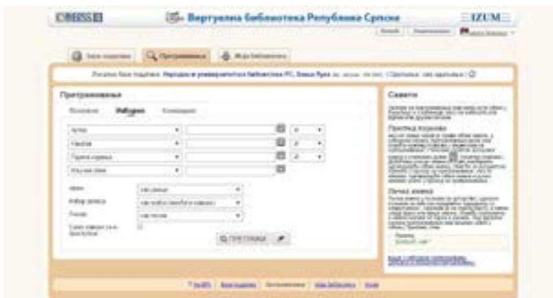
Приказ 2: Страница за претраживање базе података НУБ РС

Библиотеке посједују каталоге који олакшавају претрагу. Народна и универзитетска библиотека Републике Српске ( www.nub.rs ) посједује и неколико различитих електронских каталога за претрагу потребне литературе, који су организовани као и већина сличних каталога.